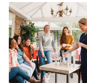
VENTAS DIRECTAS/ VENTAS LIBRES