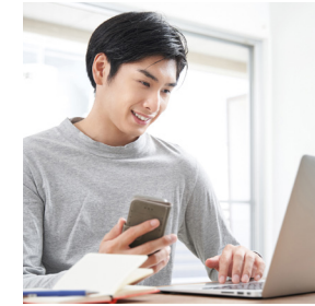
TRABAJO A DISTANCIA

El mundo ha sufrido grandes cambios y la forma de trabajar también ha cambiado. En lugar de las rutinas aburridas, el tráfico desquiciante y las oficinas repletas de cubículos, la gente se ha abierto a nuevas y grandes posibilidades para ganarse la vida. Ya no buscan simplemente un trabajo para pagar las facturas, sino un medio gratificante para mantener a sus familias. Siguen buscando seguridad, pero quieren una forma de conseguirla que tenga sentido, que añada valor a los demás y que permita la expresión personal. Esto ha creado una “tormenta perfecta” de oportunidades gracias a tendencias que evolucionan rápidamente, como estas: