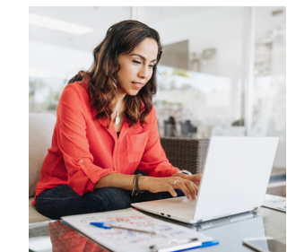
NEGOCIOS EN CASA