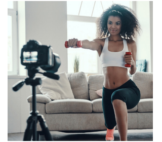
NEGOCIOS CON ESTILO DE VIDA