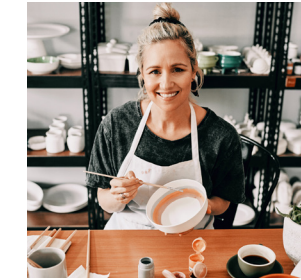
ACTIVIDADES SECUNDARIAS CON INGRESOS ADICIONALES